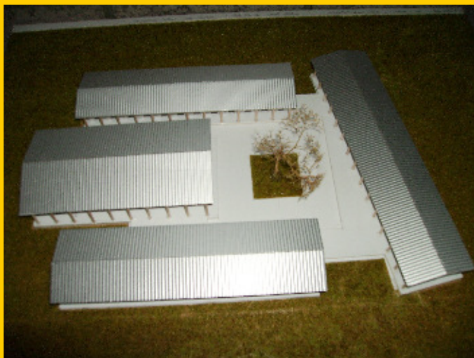
Het ontwerp van de school